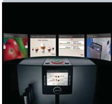
TFT-ekraan koos pöördlülitiga