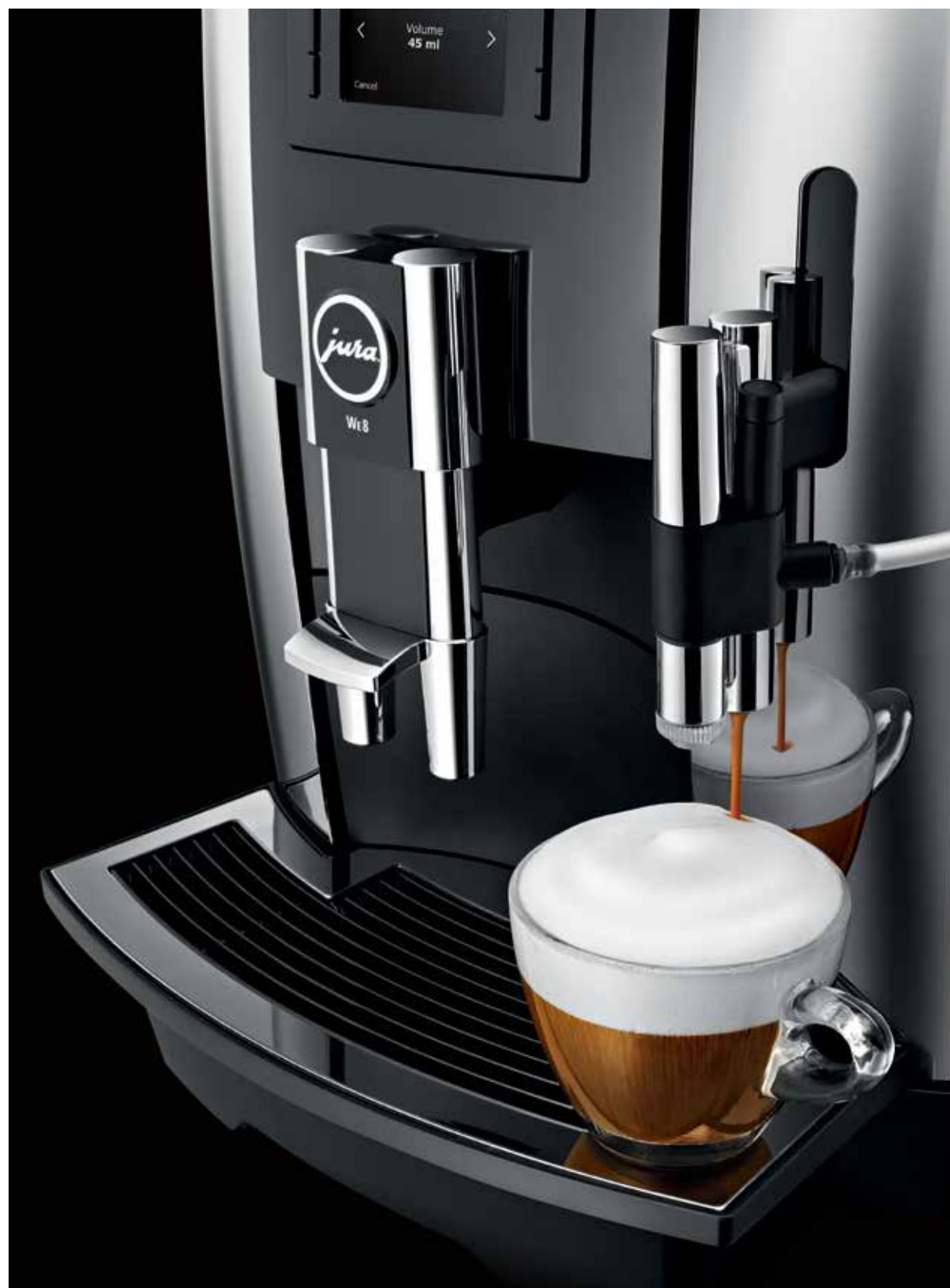
WE8 Rikkalik valik kohvijooke töökohas